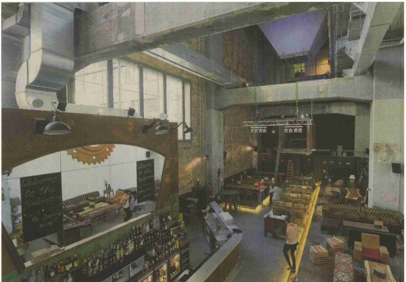
Das Kesselhaus in Winterthur bietet dem Kinobesucher mehr als nur Filme – Boilerroom mit Bar und Lounge.

Themen-Nr.: 230.34 Abo-Nr.: 1079107 Seite: 18 Fläche: 42'515 mm 2